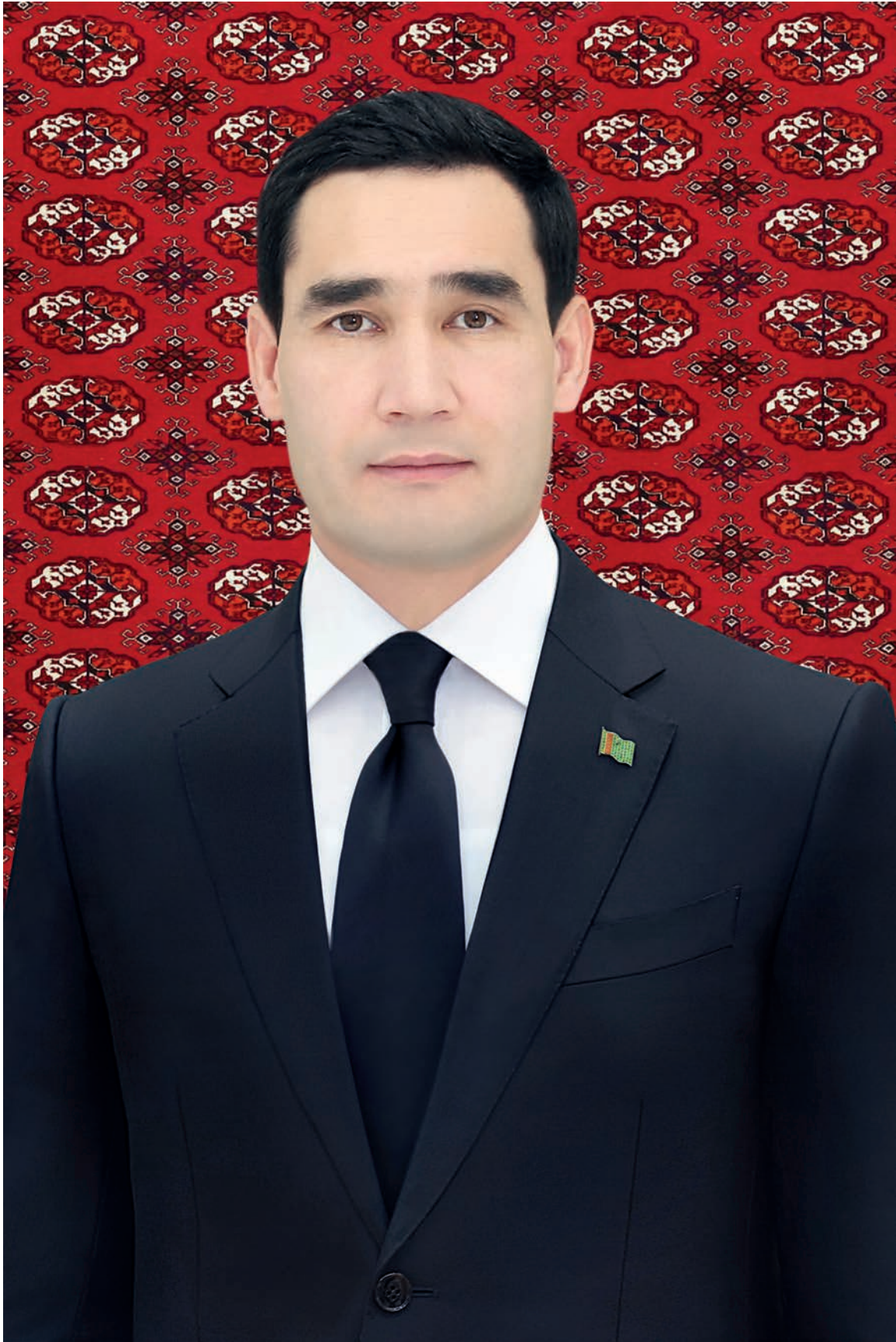
TÜRKMENISTANYŇ PREZIDENTI SERDAR BERDIMUHAMEDOW