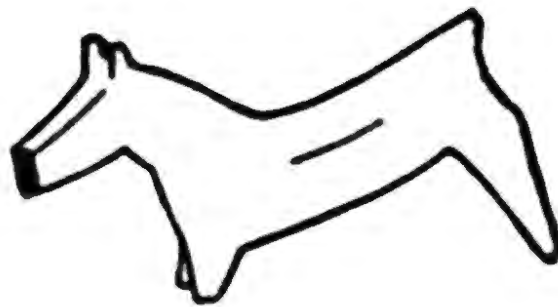
Altyndepeden tapylan itiň gadymy heýkeli

Dünyäniň ylmy jemgyýetinde Altyndepe türkmen alabaýynyň arheologiya mirasyny öwrenmekde hem iň köp maglumatlaryň ýüze çykarylan arheologiya ýadygärlikleriň biri hökmünde aýratyn orna mynasypdyr. Çünki şanly taryhymyza ilkinji dörän Oguz döwletiniň paýtagty hökmünde şöhratlanýan Altyndepede maldarçylygyň, şol sanda içiligiň milli tejribeleriniň gözbaşlaryna dahylly örän ähmiýetli ylmy subutnamalar ýüze çykaryldy. Bu ugurda önjeýli işleri alyp baran belli taryhçy Ö.Gündogdyýew «Tazy we alabaý (Türkmen itleriniň tohumy)» atly kitabynda şeýle ýazýar: «Hut altyndepeli içiler biri-birine örän ýakyn bolan ýerli itleriň dürli görnüşleriniň jübütleşdirilmegi netijesinde biziň eýýamymyzdan öňki III-II müňýyllykda häzirk wagta çenli “Türkmen alabaýy” diýlip şöhratlanyp gelen tohum iti ýetişdirmegi başarypdyrlar». Alymyň bu pikiri Altyndepede ýaşayşyň dörän müňýyllyklaryndan öňki eýýamlarda durmuşyň gülläp ösen Jeýtun we Änew ýadygärliklerinden ýüze çykarylan alabaýyň äpet göwreli irki tohumlary bilen gadymy itleriň görnüşlerini jübütleşdirip, häzirk çopan itleriniň tohumyny döredendiklerini habar berýär.