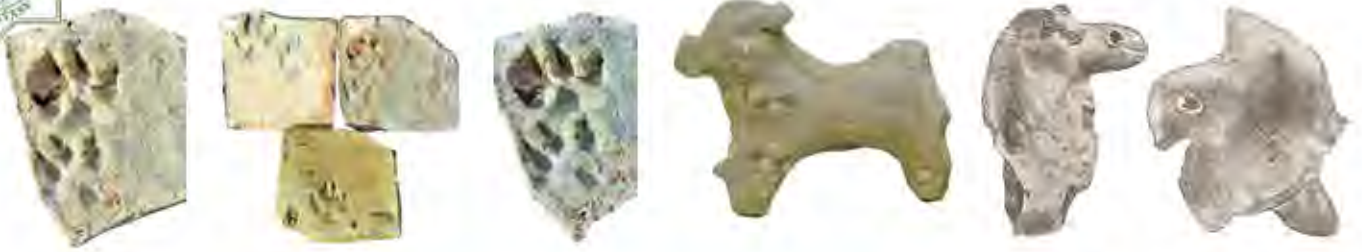
Altyndepeden tapylan alabaýnyň heýkeljikleri

Hakykatdan hem alymlara bu heýkellerdäki şekillendirilen itleriň daýaw keşbi, şeýle hem Altyndepede gazuw-agratyş işleriniň netijesinde ýüze çykarylan itleriň süňkleriniň käbiriniň iriligi hem türkmen alabaýynyň sap ganly tohumynyň taryhyny öwrenmek üçin tutarykly maglumatlary açýär. Şundan ugur alyp, Altyndepede ýetişdirilen iri süňkli, gulak-guýrugy kesilen, äpet kelleli, berdaşly aýakly alabaýlaryň çopançylyk, sakçylyk maksatlarynda ulanmagyň baý tejribesiniň emele gelendigini tekrarlap bileris.