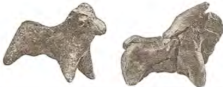
Altyndepe ýadygärliginden ýüze çykarylan gulak-guýrugy kesilen türkmen alabaýynyň heýkeli

Ýadygärlikde geçirilen arheologija gazuw-agtaryş işlerine gatnaşan alym N.M.Ýermolaýewanyň ýüze çykarylan gadymy heýkellerdäki şekillendirilen itiň keşbi barada gelen ylmy netijesi hem milli itşynaslyk tejribesinde gulak-guýrugyny kesmek ruhy ýörelgesiniň Altyndepede dörändigi baradaky pikirimizi goldaýar. Alym 1977-nji ýylda çap edilen «Türkmenistanyň gadymy ilatynyň durmuşyndan habar berýän haýwanlaryň heýkelleri» ( Животные в скульптуре в жизни древнего населения Туркменистана) atly makalasynda bu barada şeýle ýazýar: "Altyndepeden tapylan heýkeljikler türkmen alabaýynyň biziň günlerimize çenli gelip ýeten gulak-guýrugyny kesmek ýörelgesi, baryp, mis-daş eýýamynda hem meşhur bolupdyr".